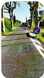
L'entrée du village sécurisée