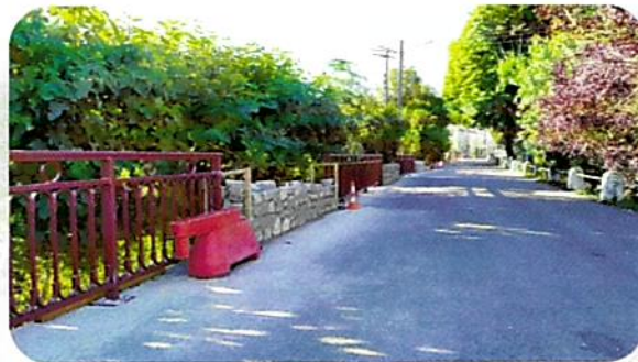
La rampe des prés