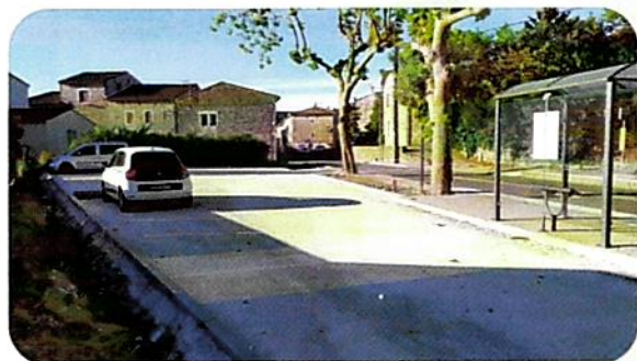
Le parking du Lauzas

Nous avons, par obligation, sécurisé l'entrée du village côté route de Montpellier (subventionné en partie par le conseil départemental). Comme quoi le travail entrepris par l'ancienne municipalité se réalise, que ce soit aussi bien le parking du Lauzas que la mise en sécurité de la départementale sur la rampe des prés (route de Saint-Hippolyte-du-Fort).